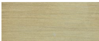
metallo ottonato satinato satin brass-coated metal